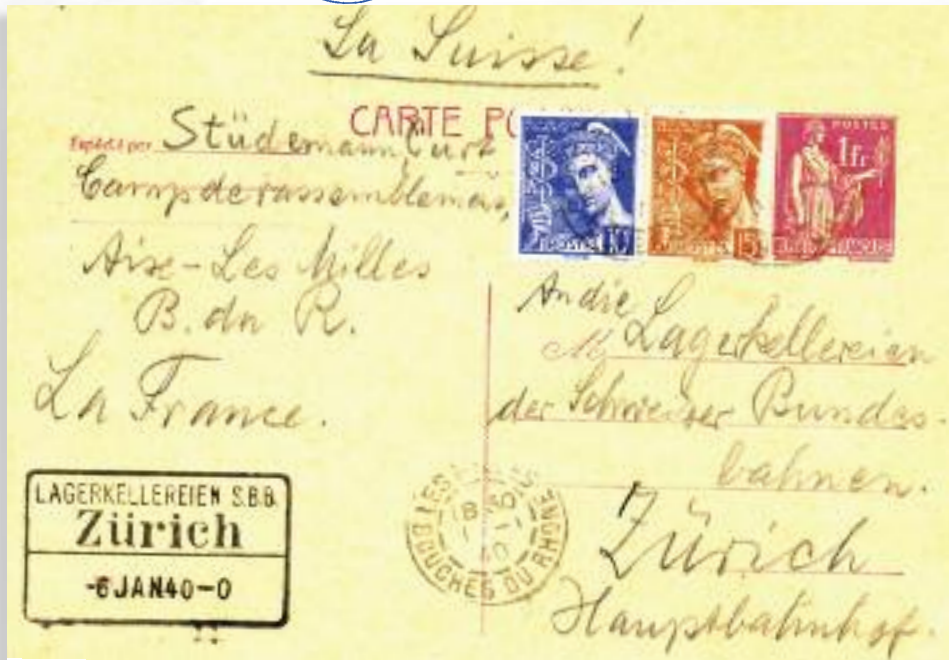
02 - Carte postale de Curt Stüdemann, interné au Camp des Milles, à destination de l'entrepôt des Chemins de Fer Fédéraux à Zurich (Suisse). Affranchissement à 1,25 F par 2 timbres Mercure à 10 c et 15 c et un timbre Paix à 1 F, à l'ancien tarif des cartes postales ordinaires pour l'étranger car celui-ci est passé à 1,50 F. Cette carte est non taxée par tolérance, nous sommes le premier jour du nouveau tarif.